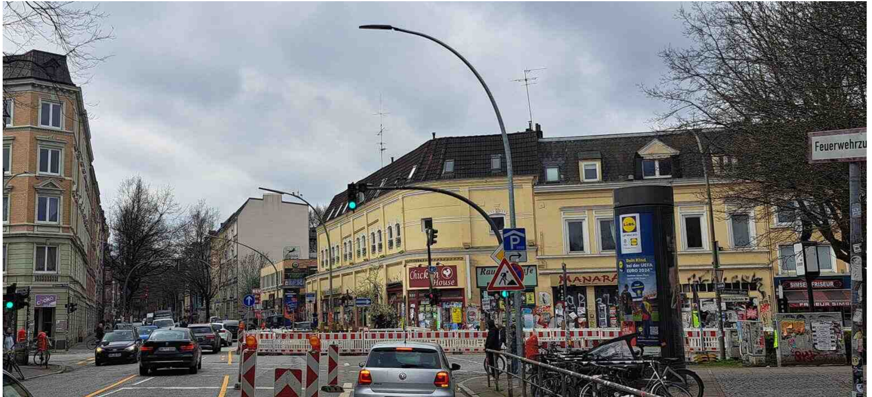
Realität an der Barnerstraße